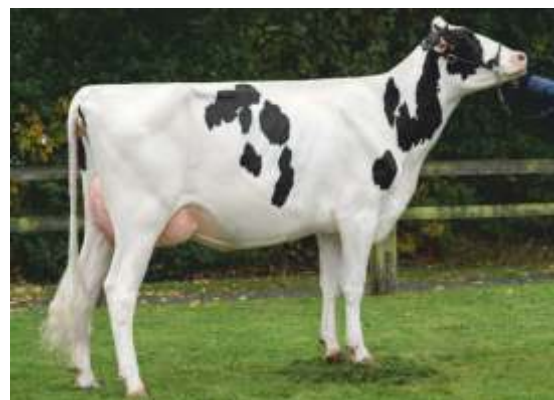
майка: Bayla 2