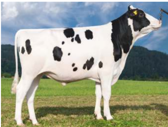
DKR DG BONNE ET