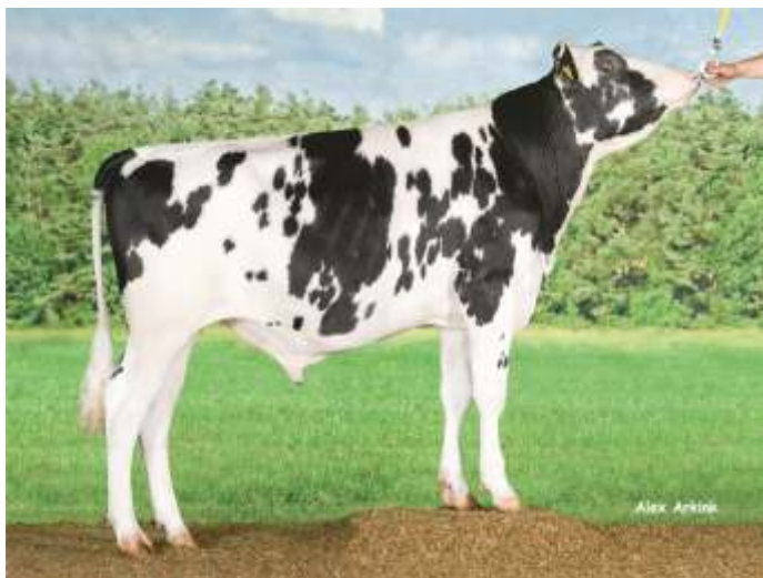
COL CRUSOE - ET

ID (ITB): DEUM000538771554 NAAB: 097HO41635 дата на раждане: 20.01.2015 Карпа Casein: AB порода: ХОЛЩАЙН