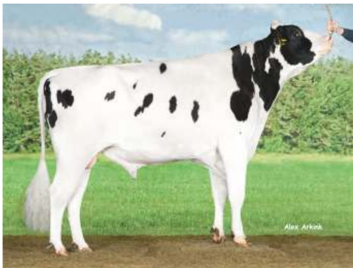
DELTA BOOKEM DANNO

ID (ITB): NLDM000739977109 NAAB:097HO40889 дата на раждане: 20.03.2012 Карра Casein:AA порода: ХОЛЩАЙН