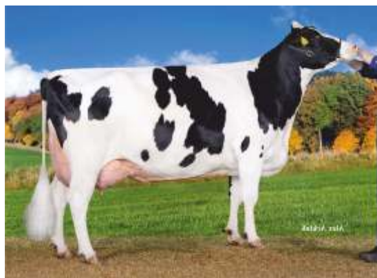
майка: Delta Riant