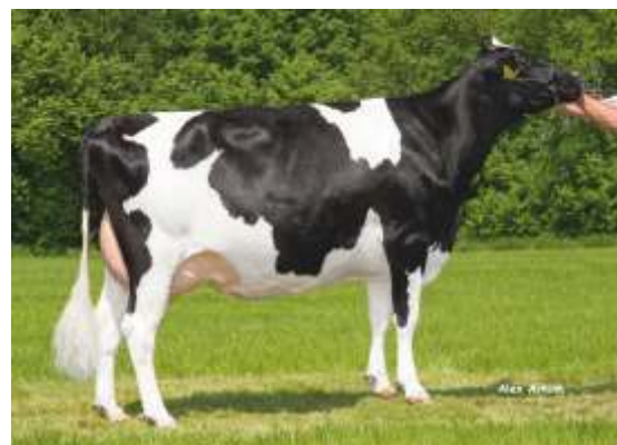
майка: Delta Rowan