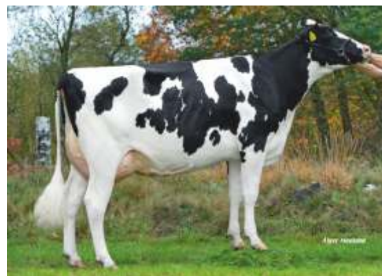
дъщеря: Vivian 2 RF