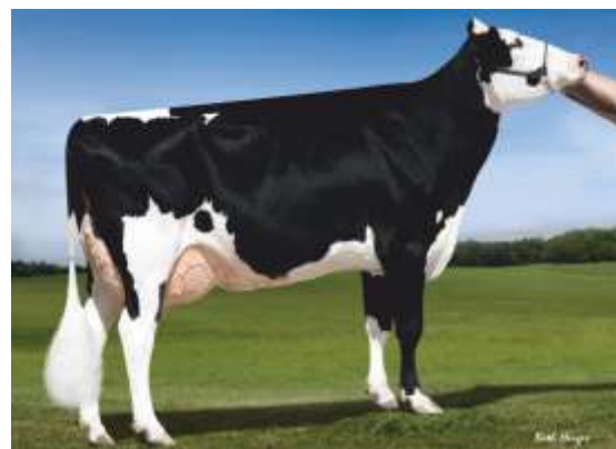
майка: Khw Super Aderyn